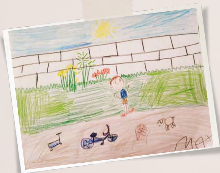
“Me gusta el patio de mi casa porque juego mucho con mi bicicleta, mi mono-patín, con mi perro y a la pelota, además ahí aprendí a andar en bici sin rueditas. Disfruto mucho jugar aquí.” Maximiliano - 7 años