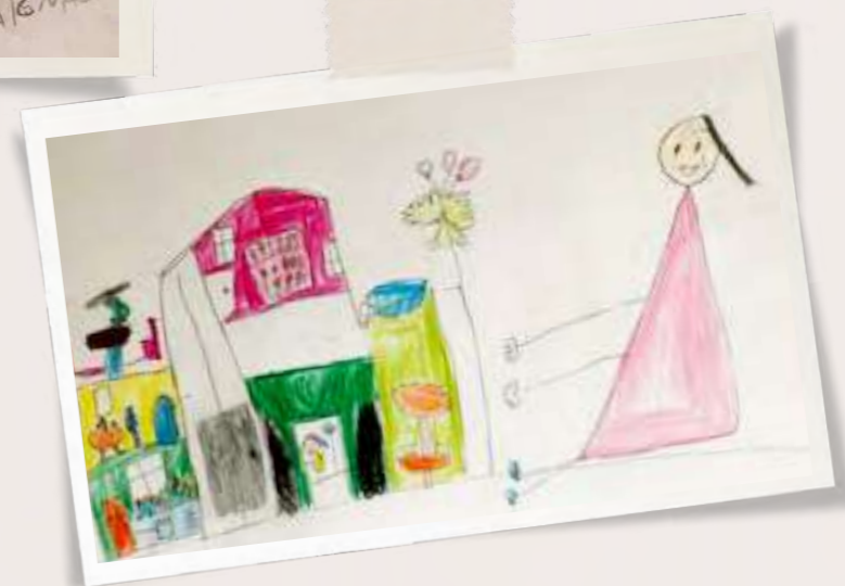
“Estoy jugando con las Polly Pocket, me gusta mi pieza porque tengo cachureos”. Elanie - 6 años